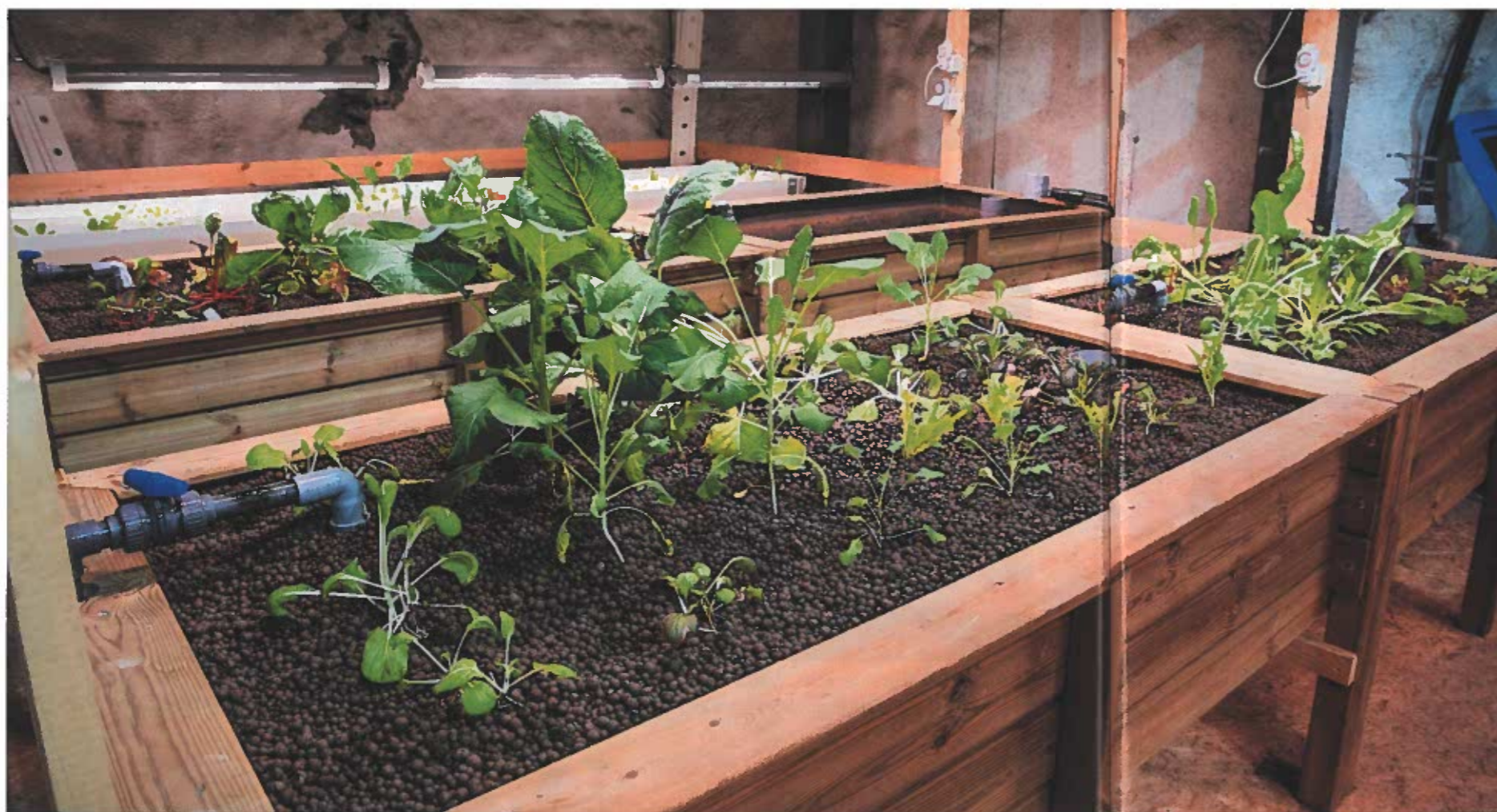
Üppiges Wachstum sieht anders aus: Das Gemüse im Hagerbachstollen wird nur mit den Ausscheidungen der Fische gedüngt. Vom Gemüsebeet kehrt das Wasser zu den Fischen zurück. Das Licht kommt von LED-Lampen.

übrigens fast alle Vertical und Indoor Farming-Anbieter, in der Kommunikation auf Bauern-Bashing: Die Landwirtschaft vergifte die Umwelt, zerstöre Böden, verschwende Wasser und der Transport vom Feld zum Kunden belaste das Klima.