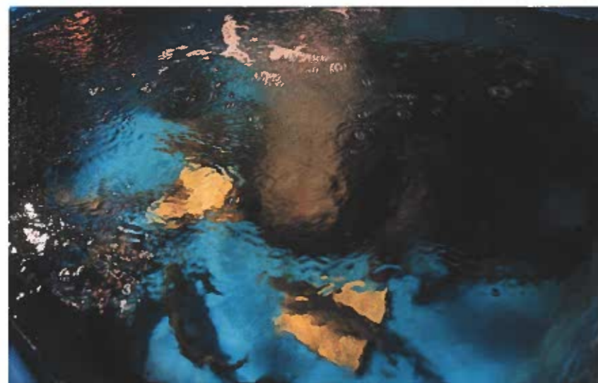
Die Exkremente dieser Fische düngen das Gemüse. Das Wasser aus den Gemüsebeeten kommt wieder zurück in die Fischbecken.

Anlagen in Kuhställen haben Yasai und Growcer in den ersten neun Monaten ihres Bestehens noch keine aufgestellt. Dafür konnten sie Business Partner wie Microsoft, Fenaco, Lafarge-